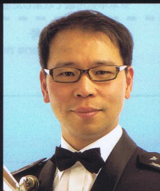
航空自衛隊 航空中央音楽隊 ユーフォニアムソリスト Japan Air Self-Defense Force, Central Band Euphonium Soloist