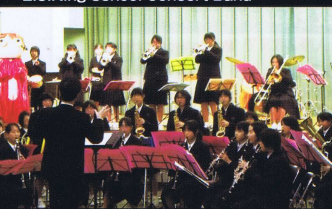
市立早岐中学校吹奏楽部 Haiki Junior High School Brass Band