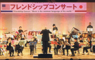
E.J. キングスクール E.J.King School Concert Band

FAX・メールでお申し込み下さい! Please apply by FAX・E-mail!