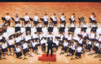
県立佐世保南高等学校吹奏楽部 Sasebo-Minami High School Brass Band Club